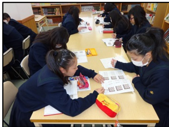
写真2 BITS PUZZLE PENCILに取り組む様子