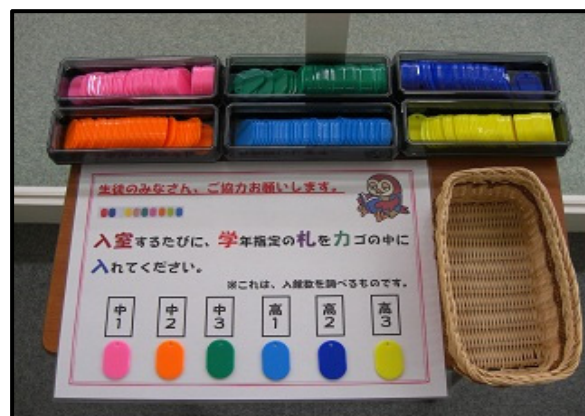
写真3 図書館入り口に設置した札

本の貸出者数よりも、来館者数を調べるためにスタートさせた。図書館入口に机を設置し、中1ピンク色・中2オレンジ色・中3緑色・高1水色・高2青色・高3黄色と指定した札を生徒に入館ごとにに入れてもらう。司書もしくはカウンター当番の図書委員が一日の終わりにチェックし、表を用いて集計した。