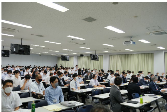
視察校との研究協議