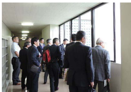
授業・施設を視察