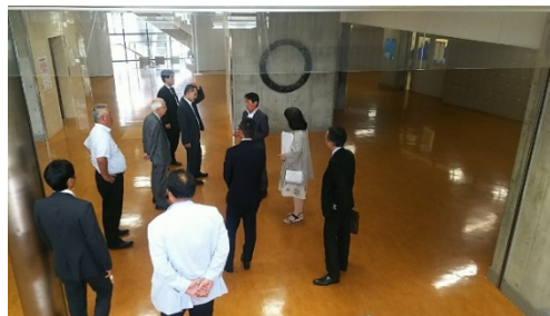
施設を視察し説明を受ける参加者