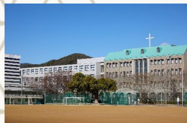
左から 京都先端科学大学附属中学校高等学校 洛星中学校高等学校

◇主催 一般財団法人日本私学教育研究所 ◇後援 京都府・京都市、京都府私立中学高等学校連合会、日本私立中学高等学校連合会 一般財団法人日本私学教育研究所 私学経営研修会担当 〒102-0073 東京都千代田区九段北 4-3-8 市ヶ谷 U N ビル 6 階 電話 03(3222)1621 FAX 03(3222)1683 ホームページ URL https://www.shigaku.or.jp/